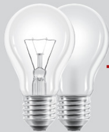
Standardlampen matt und klar

Für jede Anwendung der heutigen Glühlampen gibt es eine energiesparende Alternative von Philips